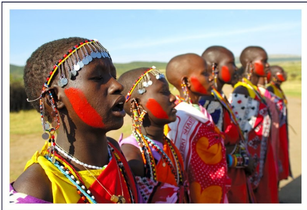
Figura 2: Treinamento de jovens da etnia Massai , no Parque Nacional do Quênia (África).