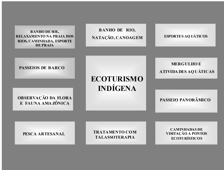
Figura 3: Produtos do ecoturismo indígena.